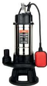
SUPERCUT - 1500