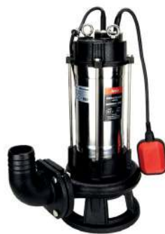
SUPERCUT - 2200