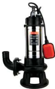
SUPERCUT - 1800