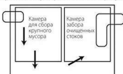
Вариант жиросъемщика с дополнительной камерой для сбора крупного мусора