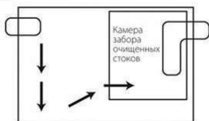
Вариант жиросъемщика без установки дополнительной камеры для сбора крупного мусора